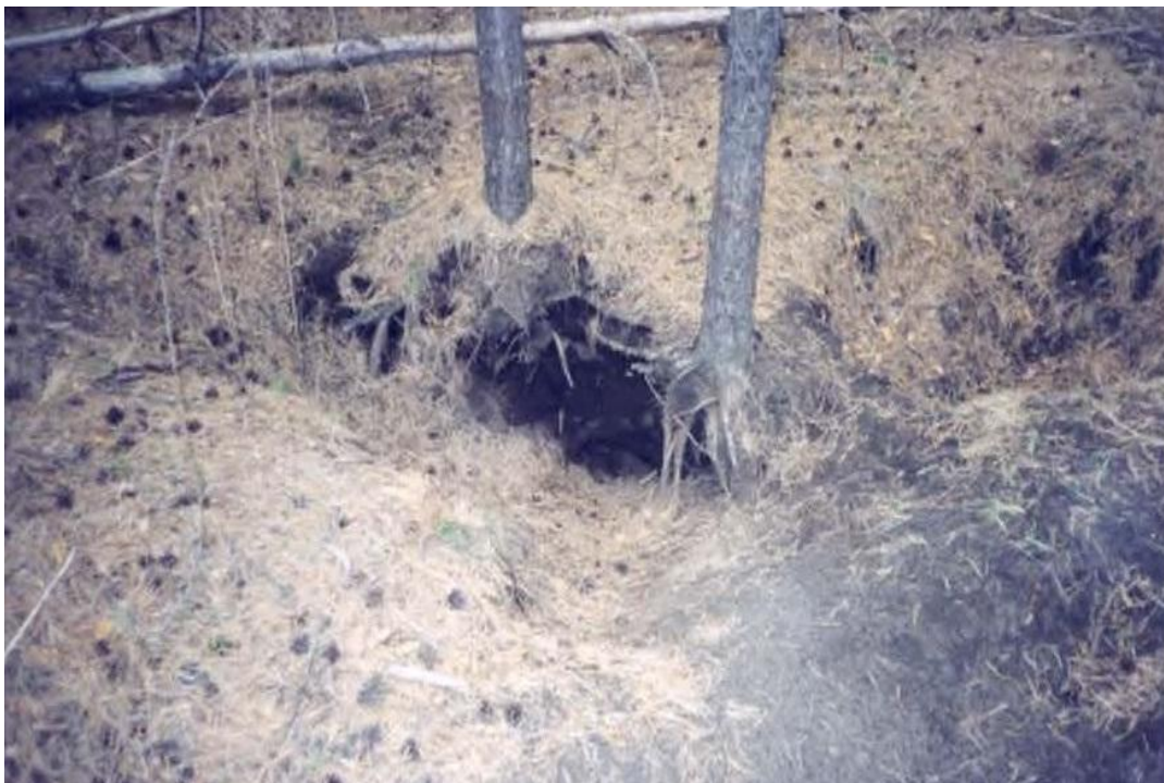
Рис. 9 – Участок леса в местах норения барсуков