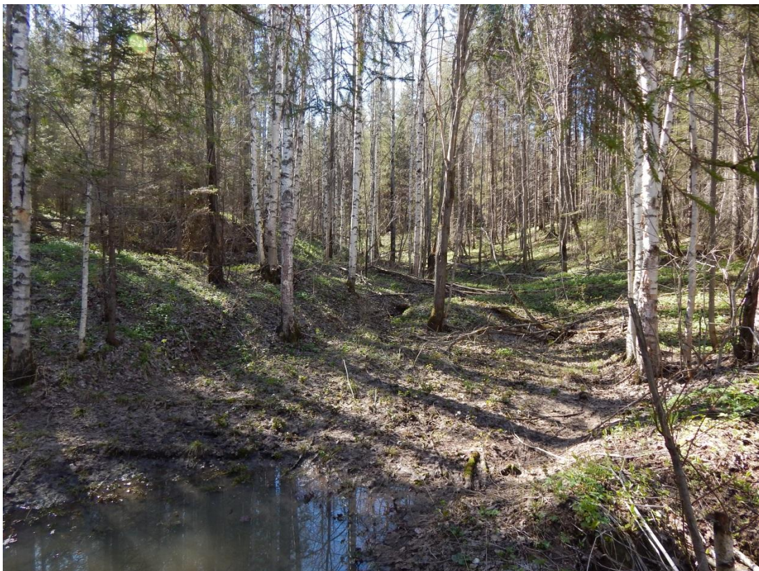
Рис. 3 – Участок леса вдоль временного (пересохшего) водотока с выраженным руслом