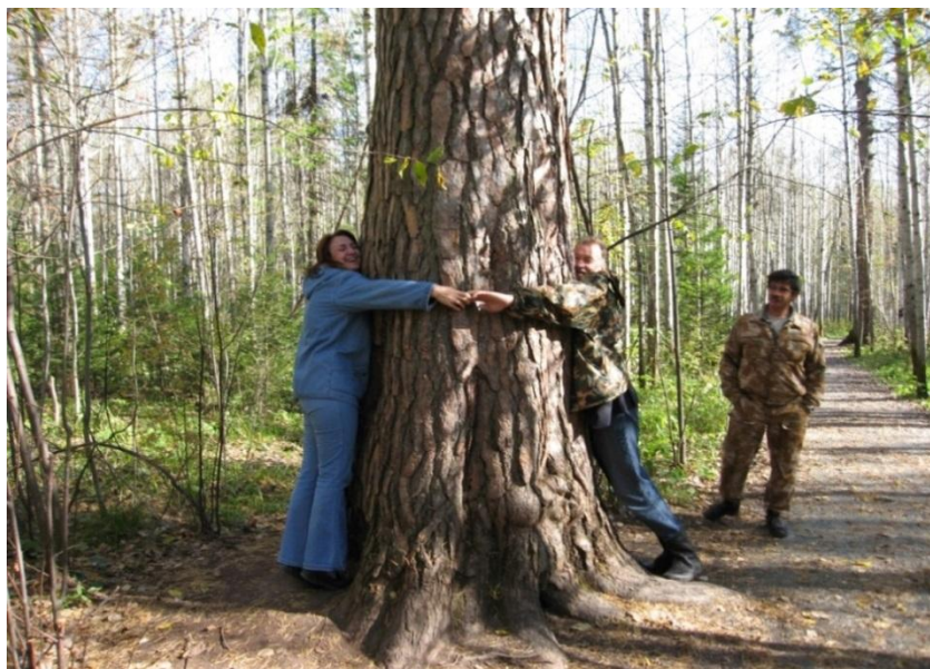
Рис. 1 – Старовозрастное дерево