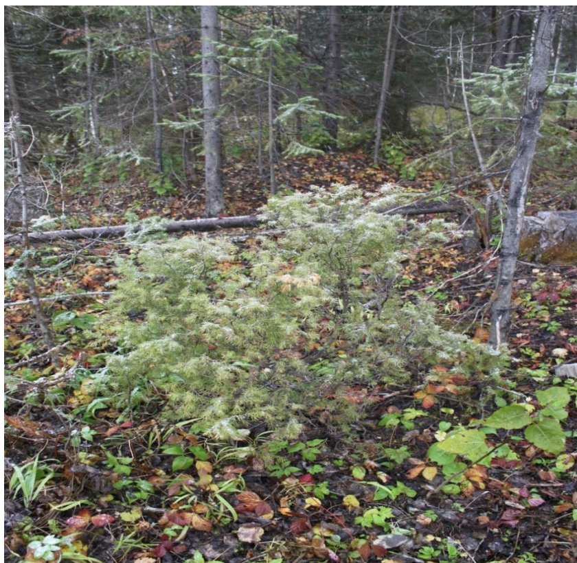
Рис. 3 – Можжевельник обыкновенный