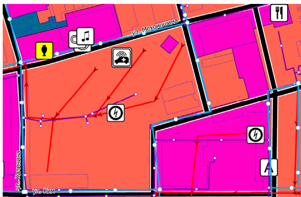
Рисунок 3 - Фрагмент «Карта границ функциональных зон городского округа» г. Александровск, Александровский муниципальный округ

В соответствии с картой градостроительного зонирования Правил землепользования и застройки Александровского муниципального округа Пермского края, территория проектирования расположена в зонах: