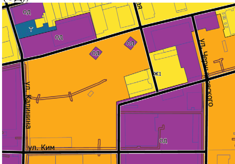
Рисунок 4- Фрагмент «Карты градостроительного зонирования» г. Александровск, Александровского муниципального округа Пермского края

59:02-7.78 Территориальная зона многофункциональная общественно-деловая зона г.Александровск Александровского муниципального округа Пермского края (ОД);