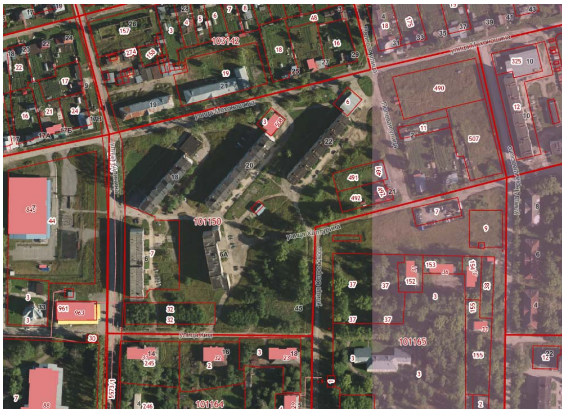
Рисунок 2 – Границы территории проектирования. Фрагмент публичной кадастровой карты

Въезд на территорию квартала 59:02:0101150 осуществляется с улиц Калинина, Механошина, Полевая, Чернышевского, Халтурина, Островского, Ким. Площадь территории в границах проектирования составляет - 8.18 га. Рельеф площадки относительно ровный, значения высотных отметок представлены на геодезической съемке. Границы проектируемой территории представлены на Рисунке 2.